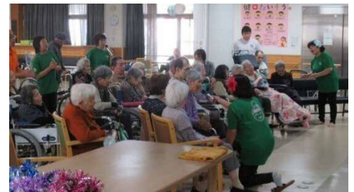
女性部員と入所者と合唱

入所者の方々とのふれあいを深めるためレクリエーションを行い、部員によるカラオケや踊り・演舞で会場を盛り上げ、部員・入所者全員で「紅葉（もみじ）」を合唱した。レクリエーションにより施設の方々とのふれあいが深まりました。