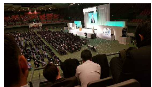
青年部 11/21～11/22 広島グリーンアリーナ