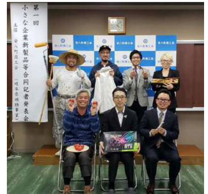
合同記者発表会の集合写真

商工会では、今後も様々な切り口で事業者に寄り添った伴走型支援を行っていききたいと思います。